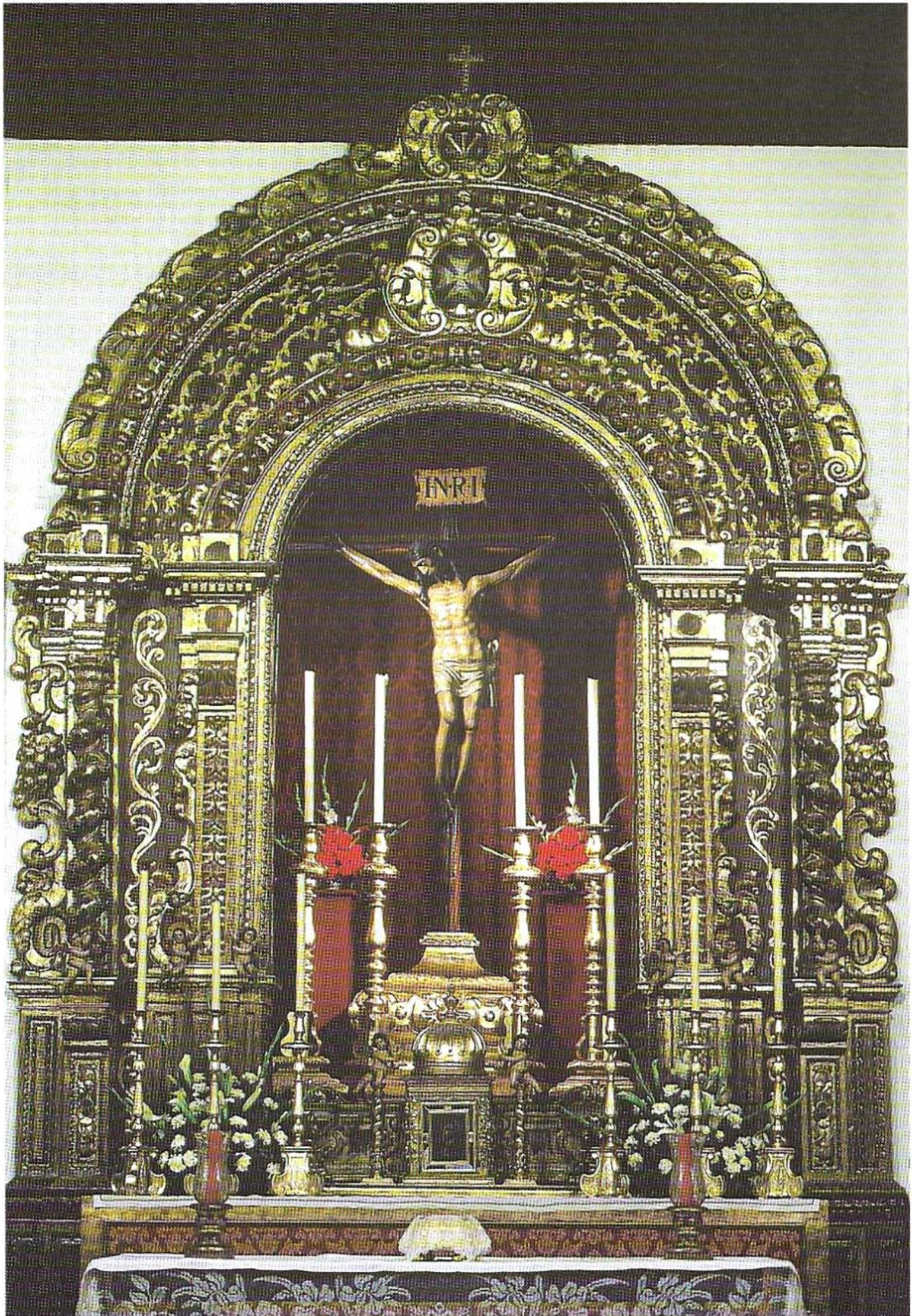
El Cerro, un lugar para la espiritualidad.