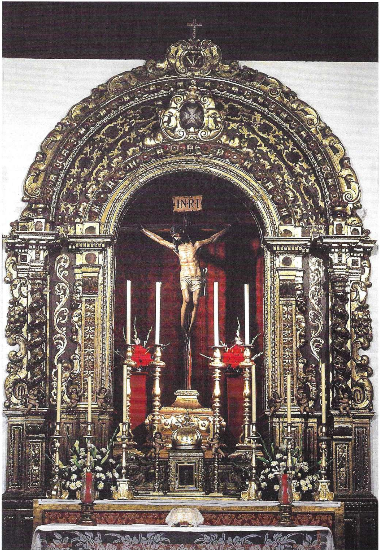
El Cerro, un lugar para la reflexión.