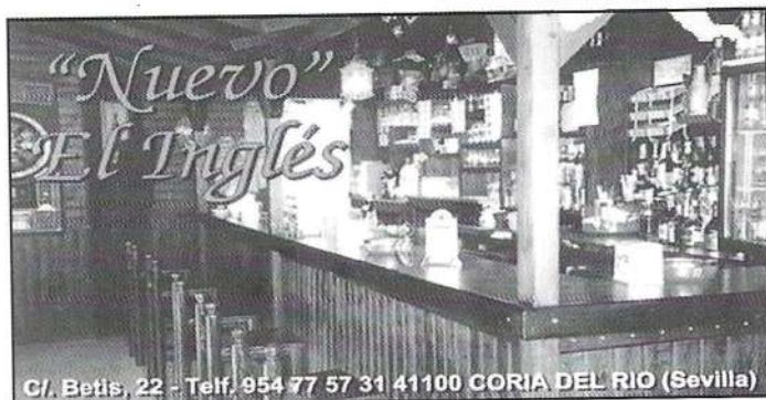
Cl. Betis, 22 - Telf. 954 77 57 31 41100 CORIA DEL RIO (Sevilla)

ELECTRICIDAD LA CASA DEL BOBINADO INSTALACIONES ELÉCTRICAS DISTRIBUIDOR DE MATERIAL ELÉCTRICO