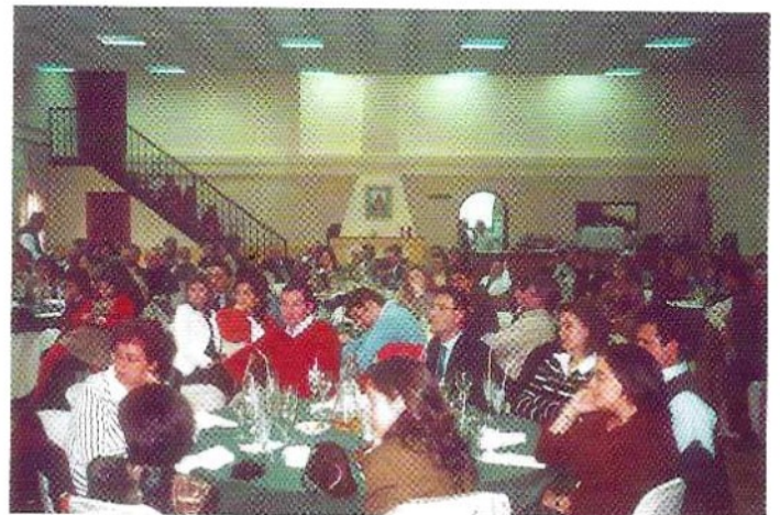
Almuerzo y convivencia de la Hermandad con motivo del 50 aniversario de la Imagen de la Virgen. Febrero de 2004