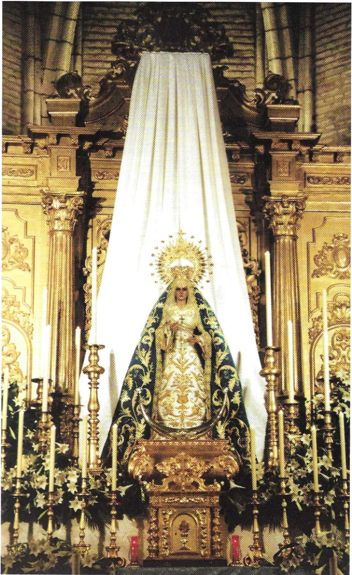
El Cerro, un lugar para la reflexión.