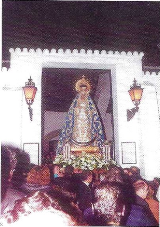
Salida de la Stma. Virgen de la Concepción hacia la Parroquia de la Estrella para la celebración de Triduo Extraordinario, 50 Aniversario de su Imagen.