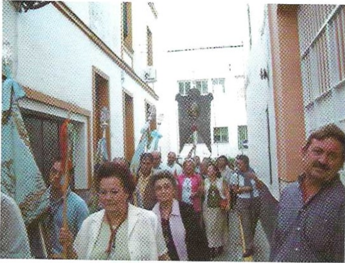
Traslado del Simpecado del Rocío a la Parroquia, acompañado de las diferentes banderas concepcionistas de las Hermandades, para la misa de peregrinos. 9 de Octubre de 2004.