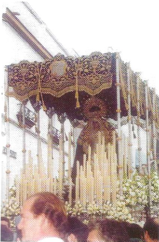
Procesión Extraordinaria de la Stma. Virgen de la Concepción. 8 de Diciembre de 2003