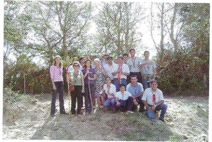
Algunos peregrinos de la Hdad. del Cerro en el Ajolí, antes de la entrada en la Aldea del Rocío, 11 de Octubre de 2004.