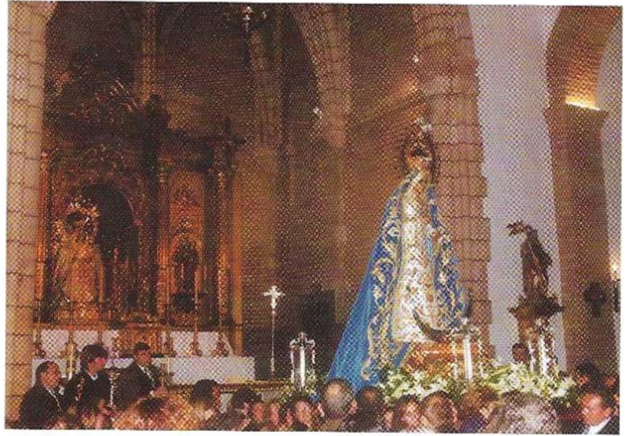
La Santísima Virgen de la Concepción a su llegada a la Parroquia de la Estrella. 4 de Diciembre de 2003