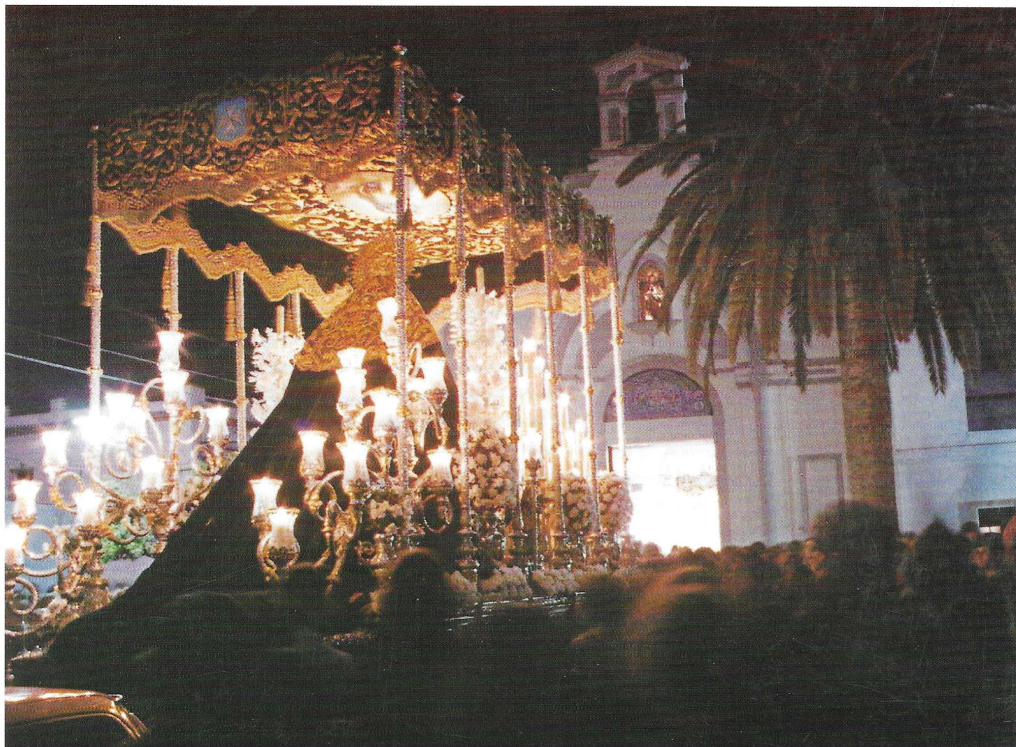
Imagen, del ayer. Al paso de María Santísima de la Concepción en la Plaza de Nuestra Sra. de la Soledad.